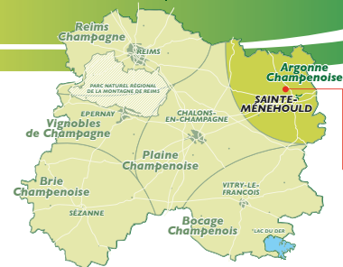
Circuit de la Bataille d'Argonne