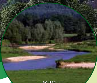
Vallée de l'Aisne