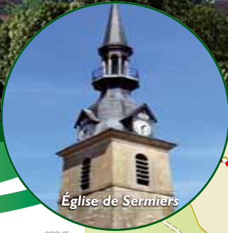
Église de Sermiers