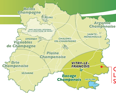
Circuit de La Marche Stirpienne

CIRCUIT GRD GRPD LIASON ROUTE CHEMIN FORÊT VIGNOBLE