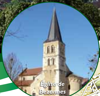
Eglise de Bezannes