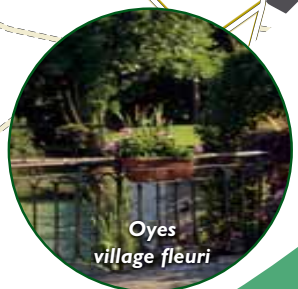
Oyes village fleuri

Au cœur des marais de Saint-Gond, Oyes a accompli un effort d'embellissement remarquable avec comme point d'orgue ses réussites aux concours de fleurissement. Cette courte balade vous permettra de découvrir l'ancienne abbaye de Saint-Gond rénovée, d'anciennes tourbières, la flore et la faune entre ruisseau et marais, le panorama sur l'ensemble des marais de Saint-Gond, la plaine de Champagne, le Monument national de Mondement.