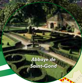
Abbaye de Saint-Gond

Circuit d'Oyes vous souhaite la bienvenue