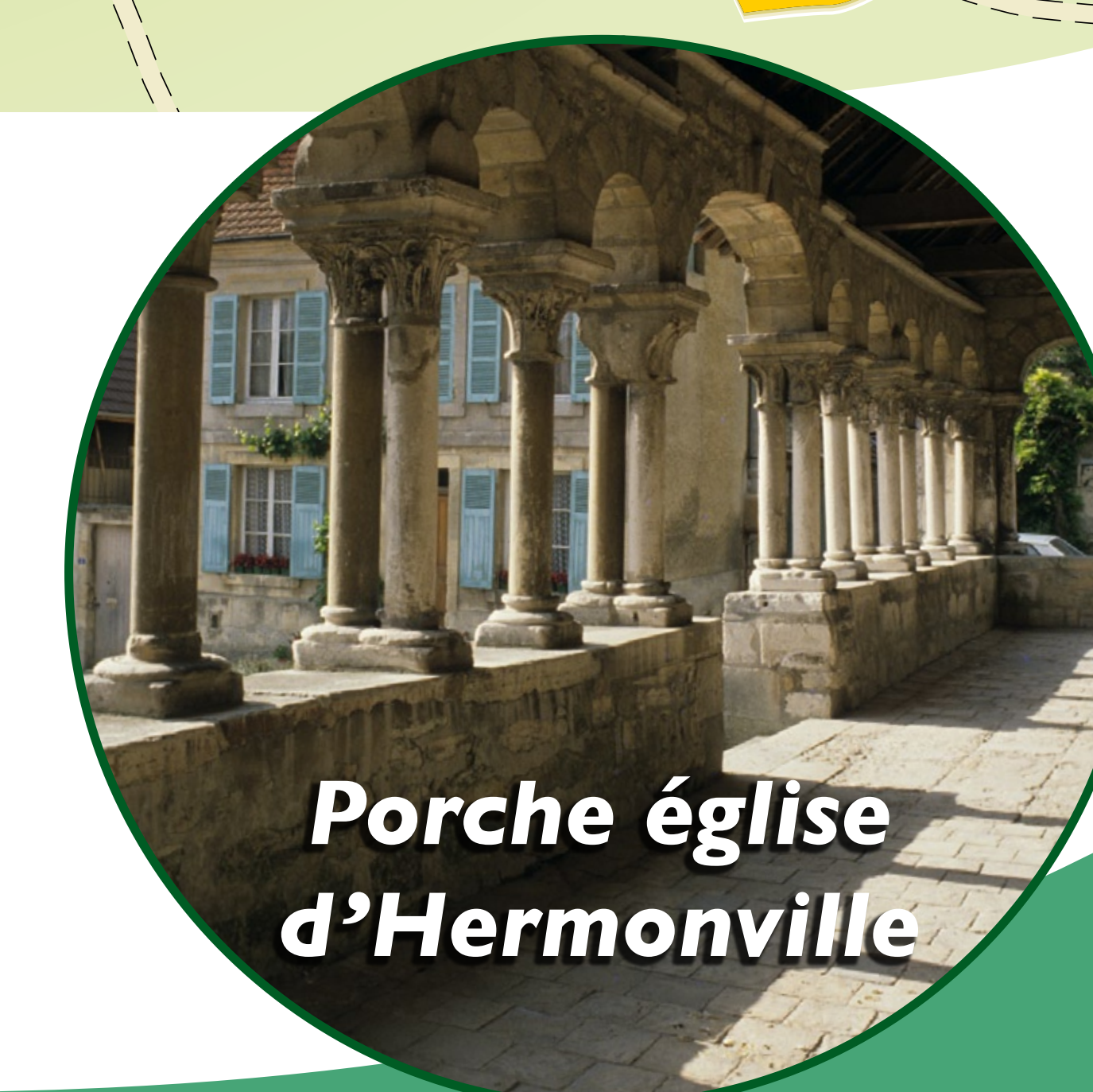
Porche église d'Hermonville

→ Point de vue sur la vallée de la Vesle et Reims