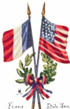
Illustration Armes célébrant l'alliance entre la France et les États-Unis. © Collection privée

RETROUVEZ TOUTE LA PROGRAMMATION SUR WWW.MARNE.FR