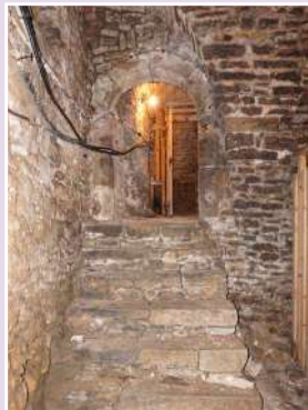
Accès à l'une des quatre caves du 6 ruelle de la Trésorerie

→ Visites flash à 10h et à 11h Rdv Porte Boulière Sans réservation Gratuit