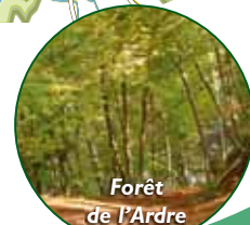
Forêt de l'Ardre

Sites à voir en chemin ou aux alentours :