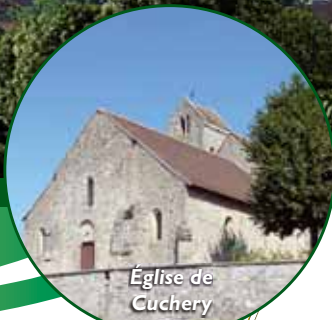
Église de Cuchery