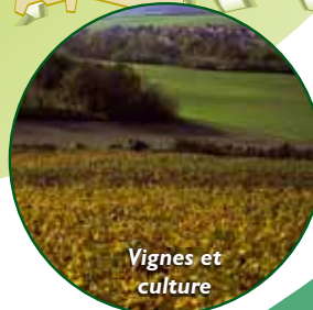
Vignes et culture

Ici, il y a 1 000 ans il n'y avait qu'une vaste ferme. Lentement le village s'est formé. On note en 1820, entre autres, les hameaux de Baslieux et de Mellerai, le presbytère, le moulin... Aujourd'hui, le vignoble prend ses aises sur les coteaux les mieux exposés. Cependant, comme il y a 1 000 ans, on trouve prairies et cultures en fond et sur les flancs nord du vallon.