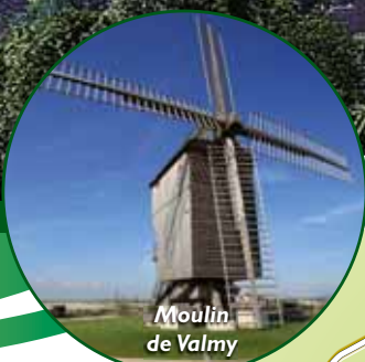
Moulin de Valmy