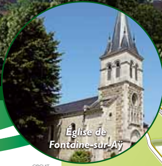
Église de Fontaine-sur-Aÿ

Circuit de la Discrète beauté de Fontaine-sur-Aÿ