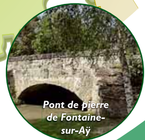
Pont de pierre de Fontaine-sur-Aÿ

Traversée par la Livre et la Germaine, Fontaine-sur-Aÿ est un village qui a su conserver son authenticité et son calme. Pour retenir l'œil : l'église, le pont de pierre, le patrimoine bâti, le mariage intime des vignes, des prairies, des champs et de la forêt.