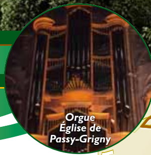
Orgue Église de Passy-Grigny

Circuit sur les Pas de Nicolas de Grigny Circuit du Chemin des Meuniers