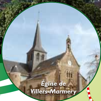
Église de Villers-Marmery