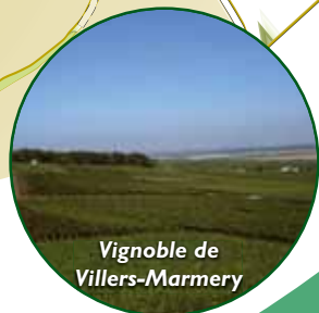
Vignoble de Villers-Marmery

Entre vignoble et sous-bois, cette petite et « sportive » (150 m de dénivelé) escapade en boucle offre une belle vue sur la plaine de Champagne.