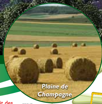
Plaine de Champagne