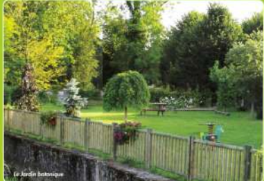
Le Jardin botanique