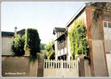
La Maison Henri IV