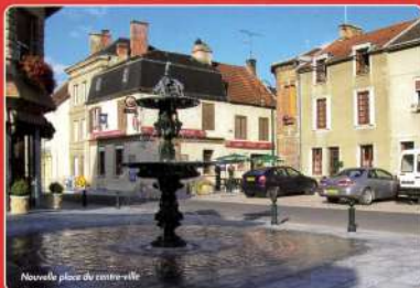
Nouvelle place de centre-ville