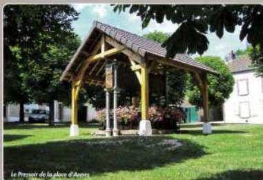
Le Pressoir de la place d'Armes