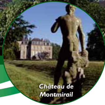
Château de Montmirail