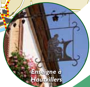
Enseigne à Hautvillers

A Hautvillers, un chant martial célèbre Dom Pérignon. En voici le refrain : Vive Dom Pérignon qui honora la France, pour mieux la célébrer et pour mieux la servir, dans vos verres versez la liqueur d'espérance, et buvez le champagne en chantant l'avenir. Panoramas superbes sur Épernay et le confluent de la Marne et de son canal latéral.