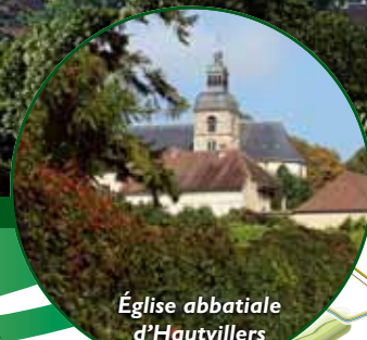
Église abbatiale d'Hautvillers