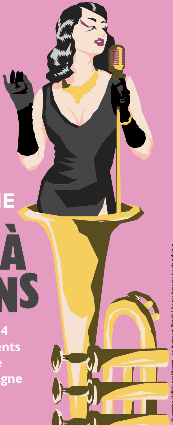
Illustration réalisée par Morgan - co-fondateur Popoki | Ne pas jeter sur la voie publique